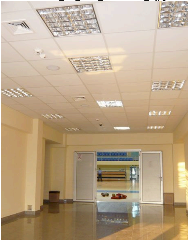
Die DYNACORD-Deckenlautsprecher passen sich in die Optik ein