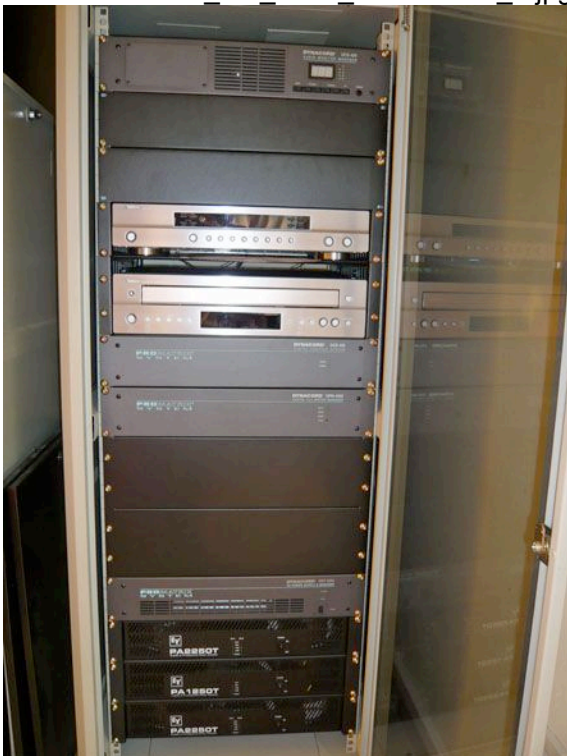
DYNACORD PROMATRIX 4000: Kombination aus ELA und Pro-Sound