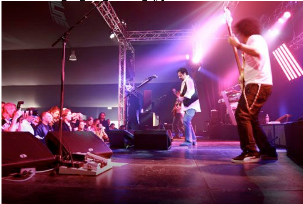
Große Begeisterung auf ...