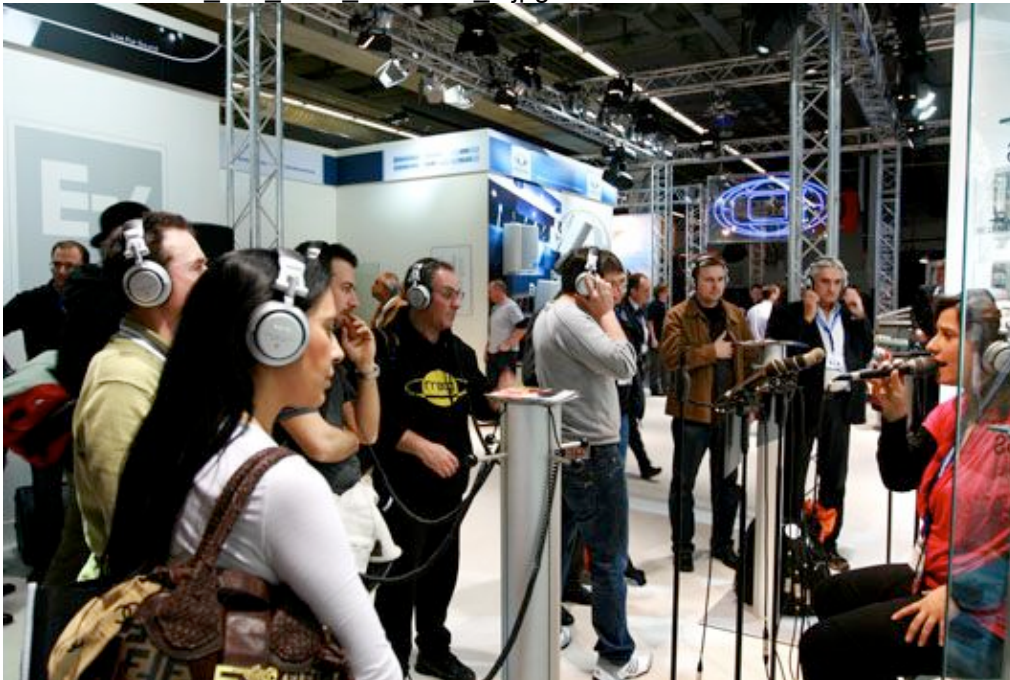
Hochbetrieb am Messestand bei den verschiedenen Live-Demos