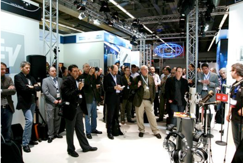
Neuigkeiten aus erster Hand: Über 60 Journalisten aus der ganzen Welt besuchten die Pressekonferenz am 2. April