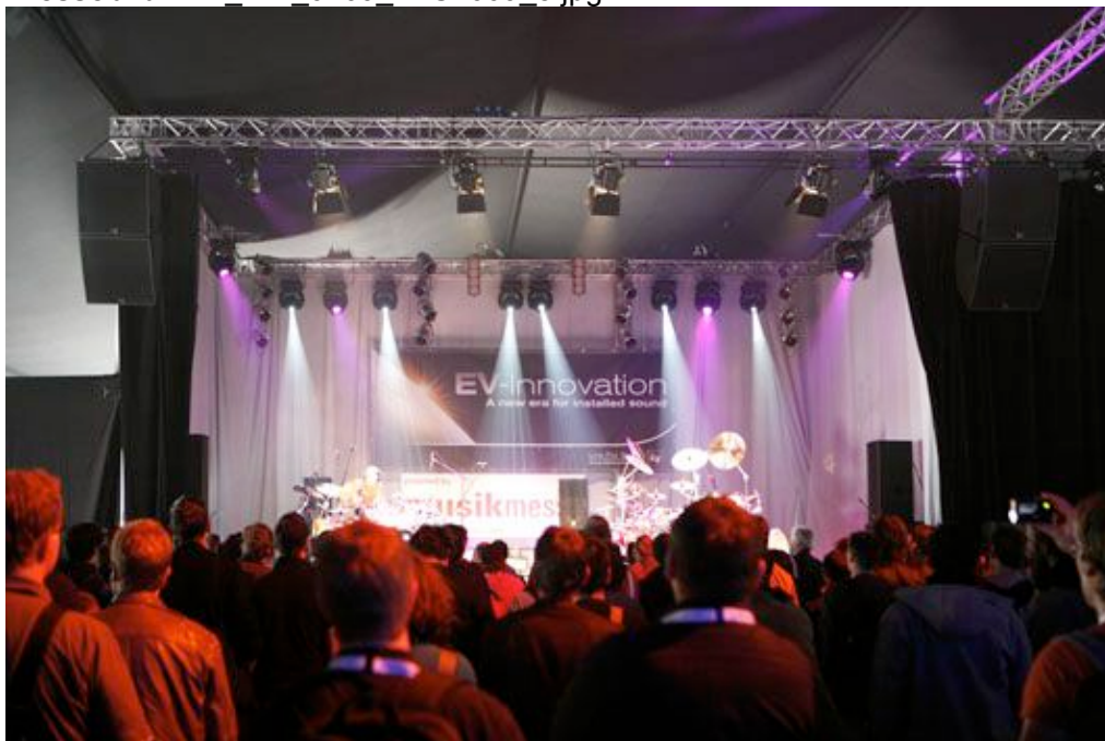
Rockiger Sound mit Festinstallations-Systemen: EVH von Electro-Voice