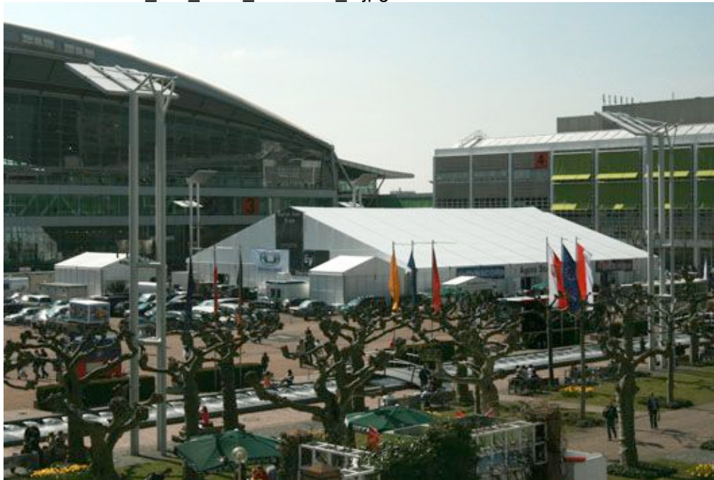
Publikumsmagnet auf dem Innenhof: das Agora-Zelt