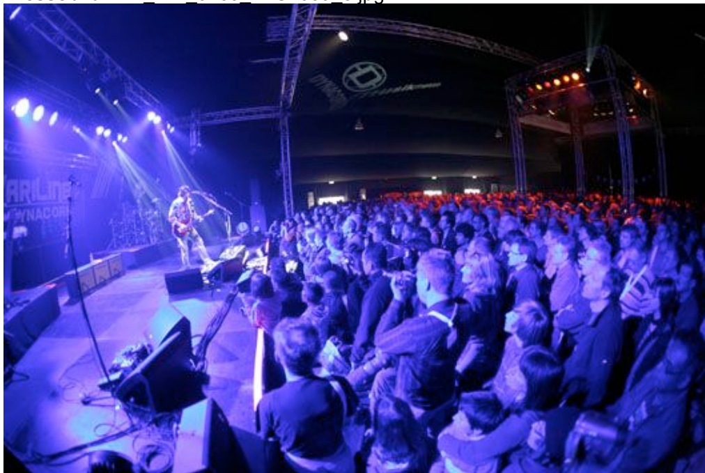
...und vor der Bühne