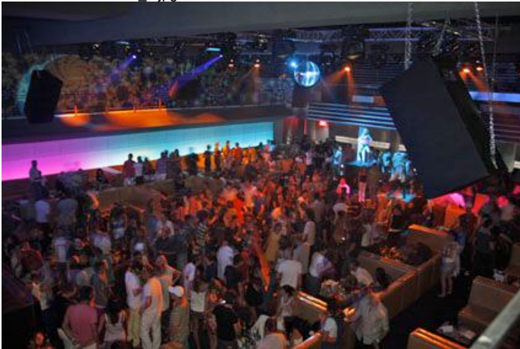
Täglich volles Haus: das „La Mania“ in Rumäniens Mamaia Resort